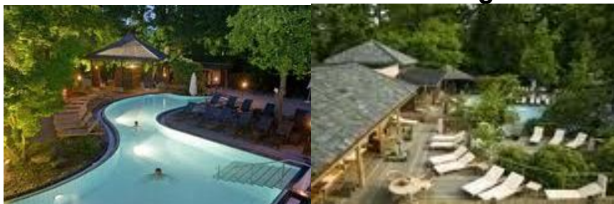
Bali-Therme, Bad Oeynhausen: alle Aussenbereiche mit Premium-Bangkirai von Sturhan